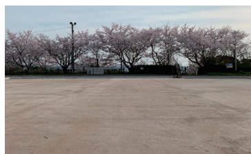
佐渡市民間駐車場 施工時期:2024年3月 施工タイプ:締固め 施工面積:700㎡