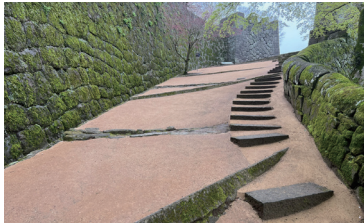
竹田市岡城址公園 施工時期:2024年2月 施工タイプ:スラリー 施工面積:150㎡