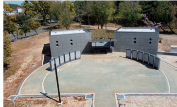
岸和田市合葬式墓地 施工時期:2024年3月 施工タイプ:スラリー 施工面積:260㎡