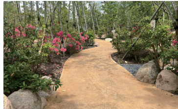
神戸市磯上公園 施工時期:2024年5月 施工タイプ:締固め 施工面積:225㎡