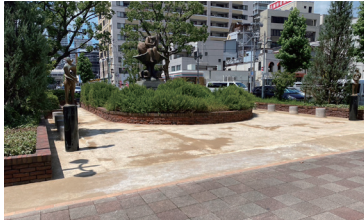
神戸市ポートセンター街園 施工時期:2024年7月 施工タイプ:締固め、スラリー 施工面積:130㎡