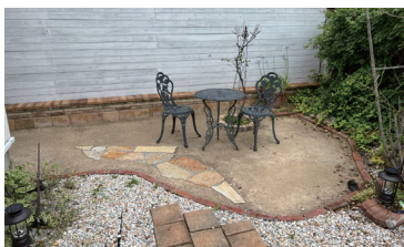
豊中市個人住宅 施工時期:2022年4月 施工タイプ:締固め 施工面積:70㎡