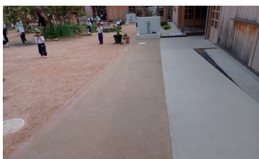
山口市幼稚園 施工時期:2023年4月 施工タイプ:スラリー 施工面積:60㎡