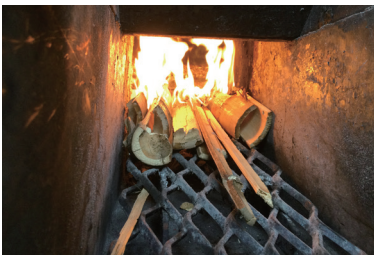
ボイラーでの燃焼状況