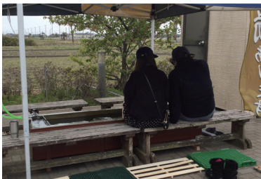
移動式タイプの足湯給湯システムの様子