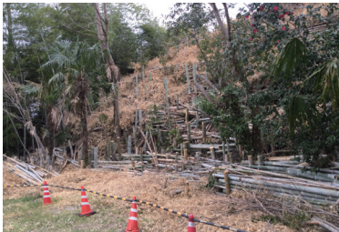
放置竹林を整備し、地域の環境を整備