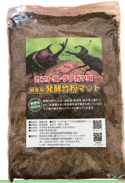
カブト虫・クワガタ虫飼育用 発酵竹粉マット

焚火やバーベキューなどに。竹ペレット(キャンプ用)は、放置竹林の整備により伐採した佐渡島の天然竹を粉碎・圧縮し円筒状に成型加工した固形燃料です。