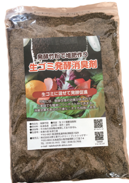
混ぜるだけ 家庭の生ゴミを堆肥にリサイクル 生ゴミ発酵消臭剤

原材料は古くから良質な竹の産地として知られている、佐渡島育ちの孟宗竹、淡竹、真竹を使用しています。化学肥料や配合材料を使用していないため、堆肥などと混ぜて作物に適した土壌環境を作ることが可能です。竹粉100%ですので、農作物や家庭菜園、ガーデニングなどに安心してご利用いただけます。※フレコンパックでの大量注文にも対応しています。