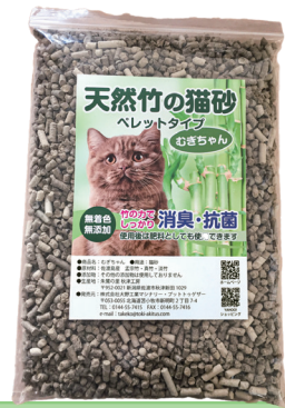
天然竹の猫砂 むぎちゃん

良質な竹を使用した昆虫マットです。発酵竹粉マットは、通気性・保温性・保水性に優れており、乳酸菌も多く土壌の微生物のバランスを整えます。竹の消臭・抗菌作用でコバエの発生を抑制し快適な飼育環境を作ります。