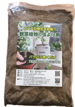
コバエの発生を抑制 観葉植物の虫よけ剤

生ゴミが消える?! 竹粉であつという間に発酵促進。竹粉には、発酵促進の効果があるので、ご家庭でも簡単にコンポストができます。消臭効果もあるので1週間後には匂いも気になりません。もちろん生ゴミを分解した後は、肥料にお使いいただけます。※フレコンパックでの大量注文にも対応しています。