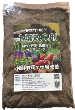
国産天然竹100%使用 土壌改良剤

すべて佐渡島産の国産の竹を粉碎し発酵させたり、ペレット化して様々な商品を開発し販売しています。