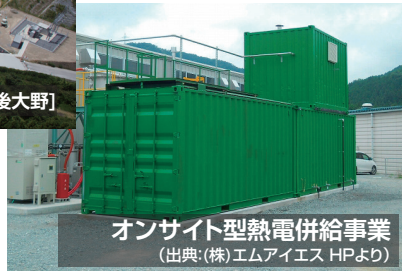
オンサイト型熱電併給事業