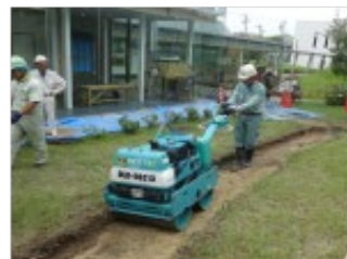
(d) 路床転圧(1t ロール)