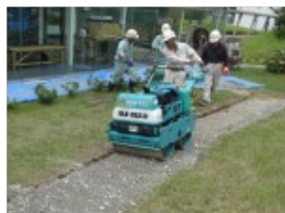
(g) 路盤転圧(1t ロール)