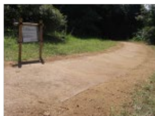
(o) 完成 全景