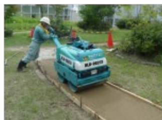
(m) 表層転圧(1t ロール)