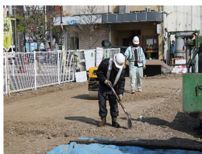
④不陸整正・転圧状況