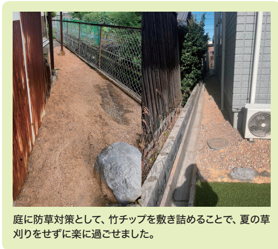
庭に防草対策として、竹チップを敷き詰めることで、夏の草刈りをせずに楽に過ごせました。

各家庭で、防草シートや、除草剤の代わりに竹チップを敷き詰めることを進めています。除草剤をまいた後のぬめりなどなく、水はけもよいので快適です。状況によっては、根物の取り除きができない場合は草が生える場合もありますが、抜けやすくなります。また、発芽しにくい成分が竹に含まれているため、新しい種は発芽しにくいです。防菌効果もあり、ペットの便の消臭効果もあります。放置竹林問題の解消(里山保全)・減少に繋がる取り組みを行い、各家庭から里山を守ります。