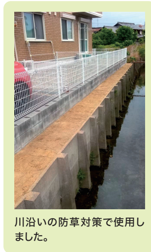
川沿いの防草対策で使用しました。