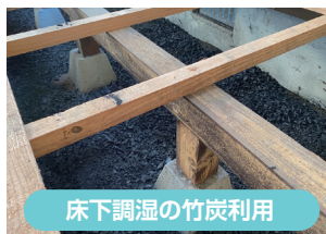
床下調湿の竹炭利用