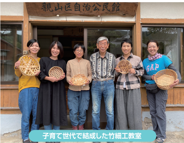
子育て世代で結成した竹細工教室