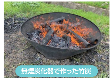
無煙炭化器で作った竹炭