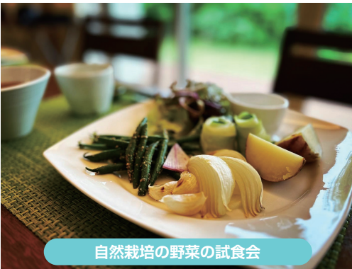
自然栽培の野菜の試食会

心身ともに健康的で楽しく続けられること、それが持続可能な暮らし方・生き方として、次世代に選ばれていくことを願っています。