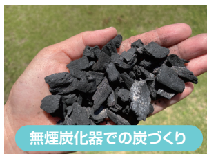
無煙炭化器での炭づくり