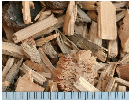
木チップ スクリーン40mm