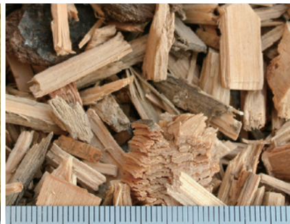
木チップ スクリーン40mm