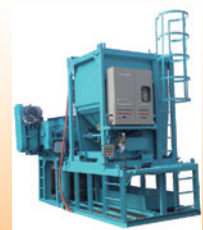
土系舗装材混合プラント

遊歩道、公園、建築の外構部、駐車場の端部、景観を重視される場所に使用できます。強度も4tトラックによる空積で乗り上げ試験1年間実施済みです。枺材も、防腐剤処理済みです。