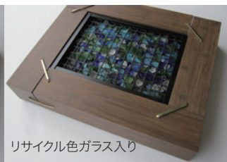
リサイクル色ガラス入り