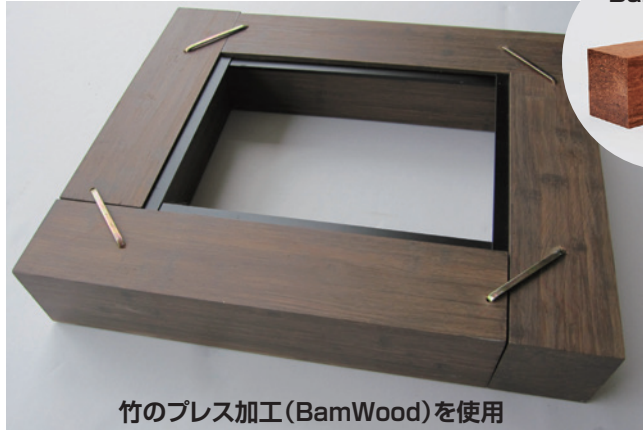
竹のプレス加工(BamWood)を使用

BamWood は孟宗竹を特殊なローラープレスで圧延圧搾し、竹の繊維(織管束)の強度特性を生かし、2600tプレスで高密度に圧縮成形した製品です。