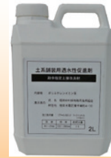
2ℓ入り200倍希釈OK 定価¥8,000+(税)