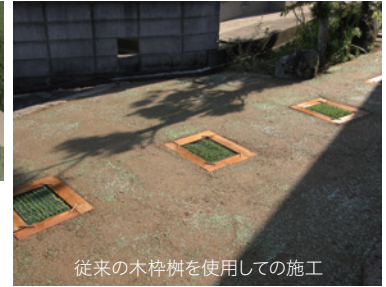
従来の木枠枺を使用しての施工