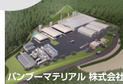
バンブーマテリアル 株式会社