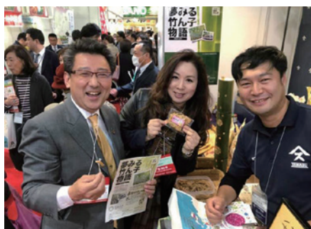
2019年3月、FOODEX(幕張メッセ) 千葉県ブースにて紹介