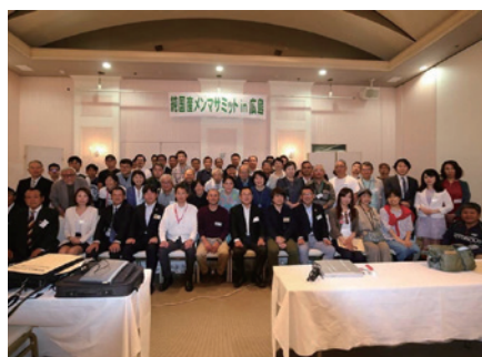
2019年5月、純国産メンマプロジェクト 全国大会・広島

地域資源活用の一環として、食するには大きくなりすぎたタケノコ(幼竹)を、約1mから1.2mくらいで収穫し、地元の漬物業者、道の駅運営会社との協力により、国産メンマを製造販売するプロジェクトです。