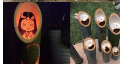
ちば里山・バイオマス協議会の活動