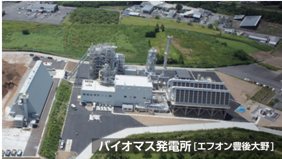
バイオマス発電所 [エフオン豊後大野]