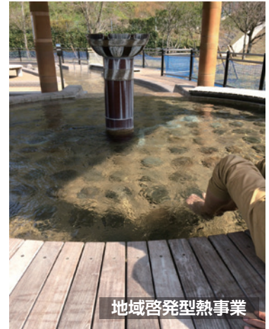
地域啓発型熱事業

豊後大野市は、地域特性を活かした経済循環・雇用の創出など人口減の抑制策が求められているなか、総務省事業である分散型エネルギーインフラプロジェクトを通じて、地域エネルギー事業、バイオマス産業等を創出し、地域活性化・雇用創出を目指します。