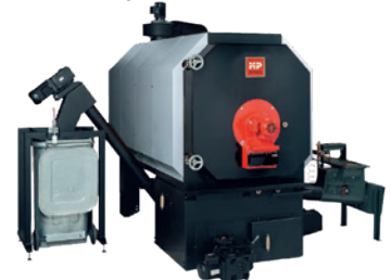
竹チップ専焼ボイラー PYROT-300

洲本市では、「バイオマス産業都市構想」に基づき「竹チップ専焼ボイラー」をウェルネスパーク五色の温泉施設「ゆ〜ゆ〜ファイブ」に設置し、2017年4月より熱供給を開始しています。竹チップを温泉加温用の重油代替燃料として大量に安定的に消費することで、放置竹林の伐採・適正管理を進めています。