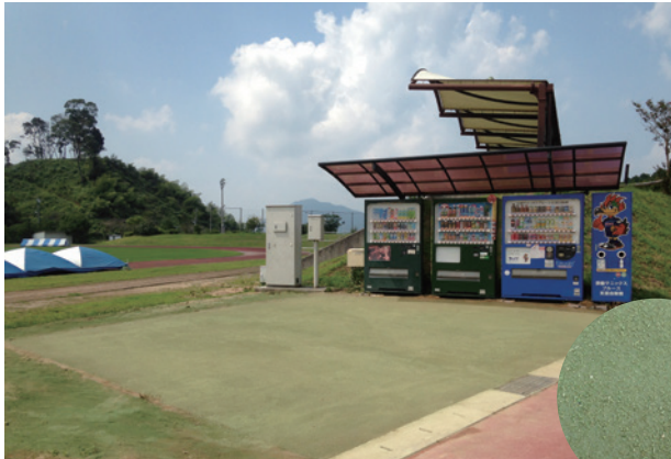
[ 福岡県宗像市グローバルアリーナ デモ施工 (40㎡) の事例 ]